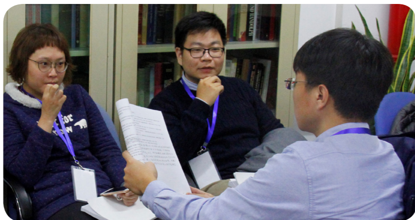
◎同學們於會議中進行交流互動

在此次交流，發現台灣在人文的學術研究上奠定的研究方法與思考，對比香港或是中國以及韓國的研究方法，台灣的研究方法多注重文本歷史化的脈絡與創作目的去進行思考，這樣的研究方式奠定台灣自己非常獨特的思考和研究方法，且能激發此次研討會上深刻的討論與思考，一方面能讓國外看見台灣，也能藉由深刻的討論更了解彼此然後看見台灣。