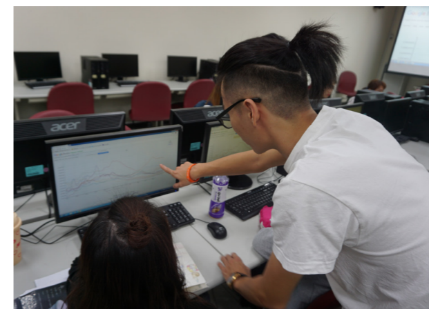
◎同學們透過操作電腦來查找資料