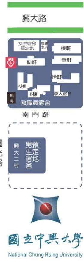
校區位置總配置圖